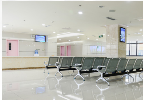
病院受付・待合室