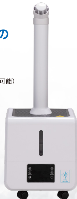
PK-804S-EP3000 ※メインパイプのみ装着時の画像です。

POINT 5 間欠運転機能(1、3、5分間隔) 1分運転 → 1or 3or 5分停止 → 1分運転